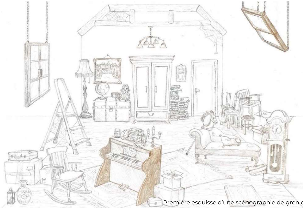
Première esquisse d'une scénographie de grenier

Nous avons donc choisi, comme terrain de jeu, de recréer un grenier . Comme ces enfants que nous étions, les interprètes seront en interaction constante avec cette scénographie modulable , manipulant meubles et objets entassés, transformant ainsi l'espace au grès des scènes, à vue et en direct.