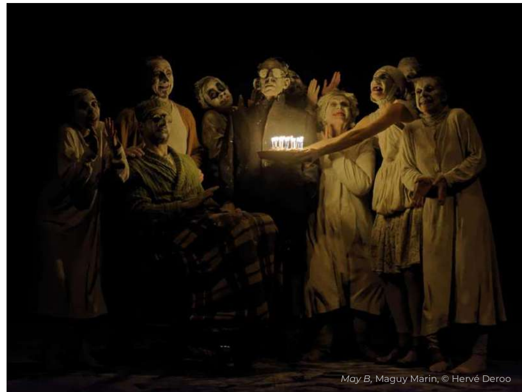
May B, Maguy Marin, © Hervé Deroo