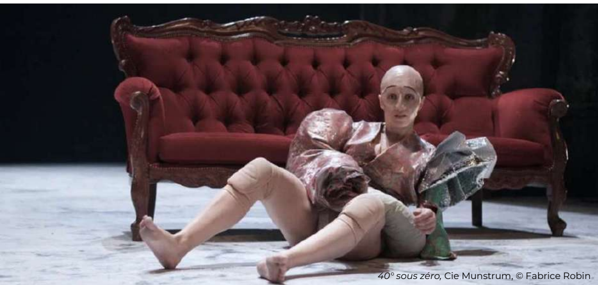
40° sous zéro, Cie Munstrum, © Fabrice Robin